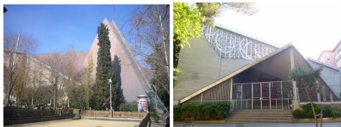
Església Sant Joan Bosco

L'arquitectura, l'escultura, l'art i l'espiritualitat, reunit en un edifici que marca el caràcter del barri de Navas, districte de Sant Andreu, Barcelona.