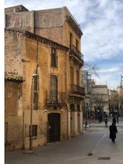
Casa del Oficial del carrer del Pont

Soy la casa número 4, la Casa del Oficial. Una pequeña placa lo indica en la pared.