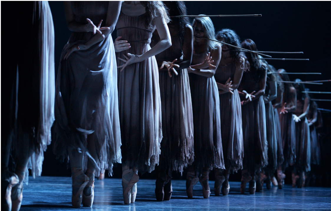
Giselle d'Akram Khan. English National Ballet.