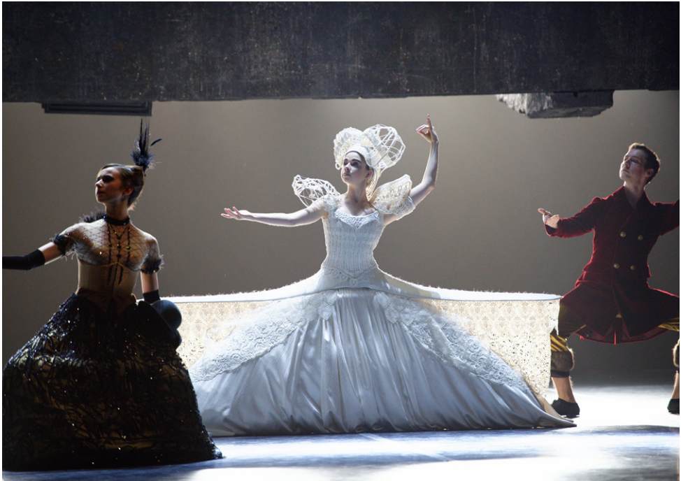
Giselle d'Akram Khan. English National Ballet.