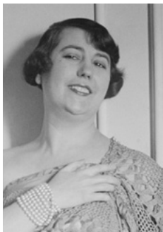
Elvira de Hidalgo