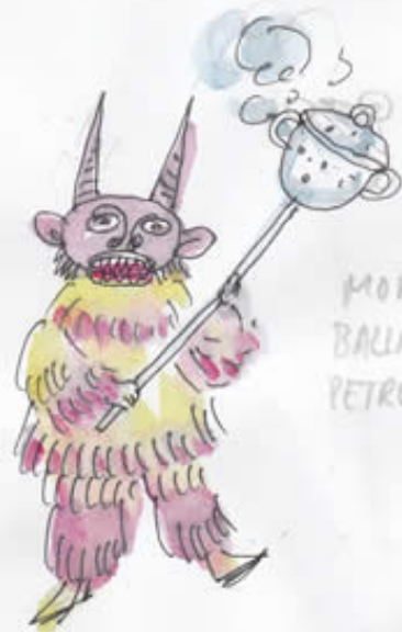
MORO BALLARINA PETRUSKA