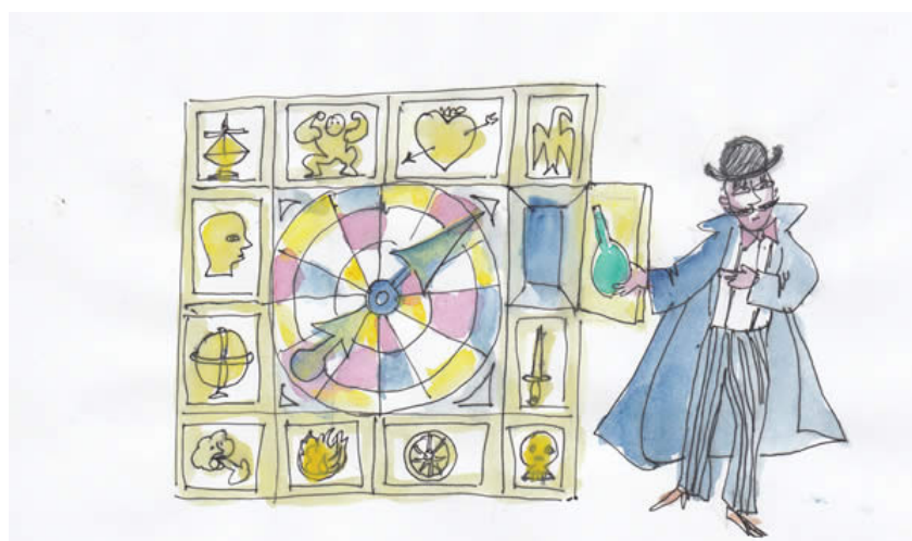
(El Mag ofereix unes begudes màgiques als nois de la fira.)

Els dos nois i les dues noies es desperten, com per art de màgia, enmig de la fira, plena de llum i de músiques. Hi ha jocs de pilotes, una parada dels dolços, un músic ambulant, una ruleta de la sort, begudes màgiques... De cop, el Mag atreu l'atenció de les dues parelles al centre de la fira i obre les cortines del seu teatret de titelles. Apareixen els tres protagonistes de la nostra història: el titella Petruixka, el titella Ballarina i el titella Moro. El Mag els dóna la vida amb un truc de màgia i es converteixen en persones de carn i ossos. Els tres titelles-persona es posen a ballar, i Petruixka s'enamora de la Ballarina, però el Moro persegueix Petruixka perquè ell també està enamorat de la Ballarina.