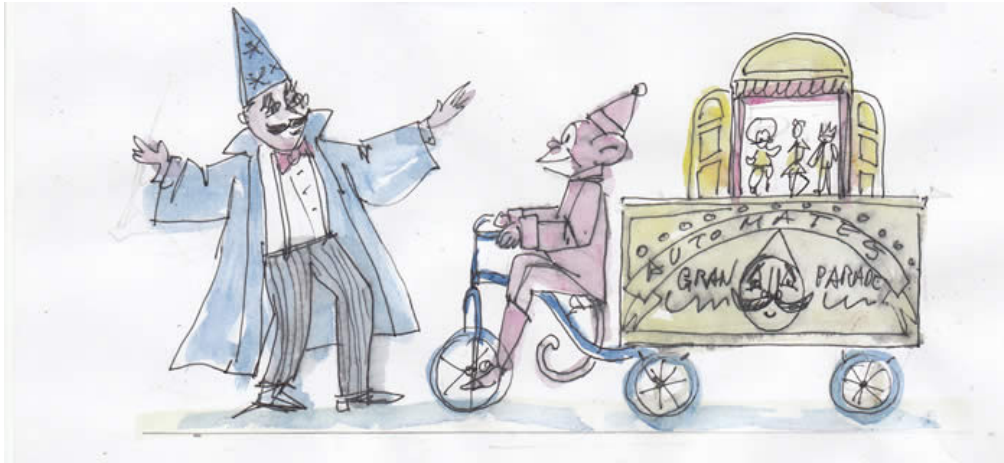
(El Mag i el seu ajudant)