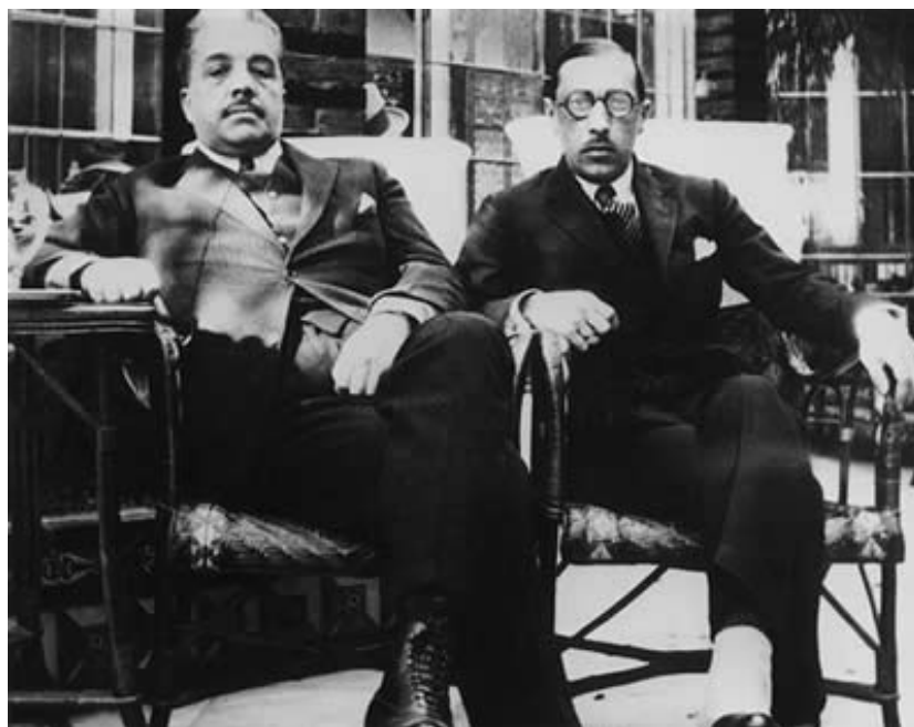
(El productor Serge Diaghilev i Igor Stravinsky)

Evidentment cap d'aquestes utilitzacions musicals no treu gens de mèrit al talent compositor d'Stravinsky sinó que, ben al contrari, il·lustra la complexitat de la música d'aquest ballet.