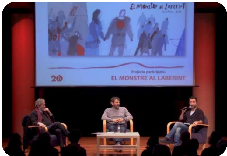
DIÀLEGS SAVALL-CAMPS Reflexions al voltant de la realitat de les persones migrades i refugiades.

Jordi Savall. Ambaixador de la Unió Europea pel diàleg intercultural el 2008 i Artista per la Pau escollit per la UNESCO.